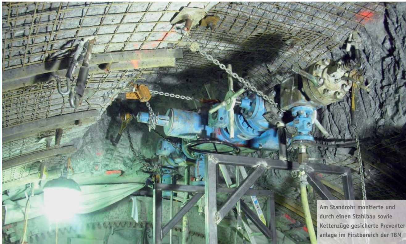
Am Standrohr montierte und durch einen Stahlbau sowie Kettenzüge gesicherte Preventeranlage im Firstbereich der TBM