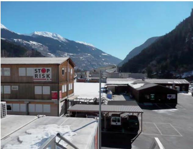
Baustelle Faido über Tage

Sondierstollen (Durchmesser ca. 5 m) mit einer Tunnelbohrmaschine (TBM) aufgefahren. Von hier aus wurden weitere Bohrungen teils bis auf Tunnelniveau abgeteuft, die zeigten, dass das Gestein in diesem Bereich stabil und vor allem trocken war. Im Zuge einer Bohrung in den oberen Teil der Piora-Mulde kam es allerdings zu einem unkontrollierten Wassereintritt. Innerhalb weniger Stunden wurden mehrere Tausend Kubikmeter Wasser, Schlamm und Gerölle unter hohem Druck in den Tunnel gespült. Das führte zum kompletten Einsanden der Vortriebsausrüstung und weiter Bereiche des aufgefahrenen Stollens. Noch vor dem Erreichen der Piora-Mulde musste der Vortrieb daraufhin eingestellt und die TBM unter Tage demontiert werden. Durch diese Erkenntnisse und Erfahrungen wurde das Gefahrenpotenzial für den späteren Tunnelvortrieb also noch einmal unterstrichen.